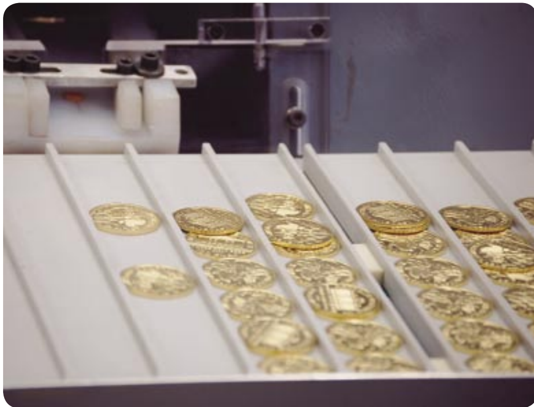
Tako letijo eno in ččo težki Dunajski filharmoniki iz stroja. Posamezen zlatnik je vreden 544,90 evra.

tom. En takšen Dunajski filharmonik stane 544,90 evra.