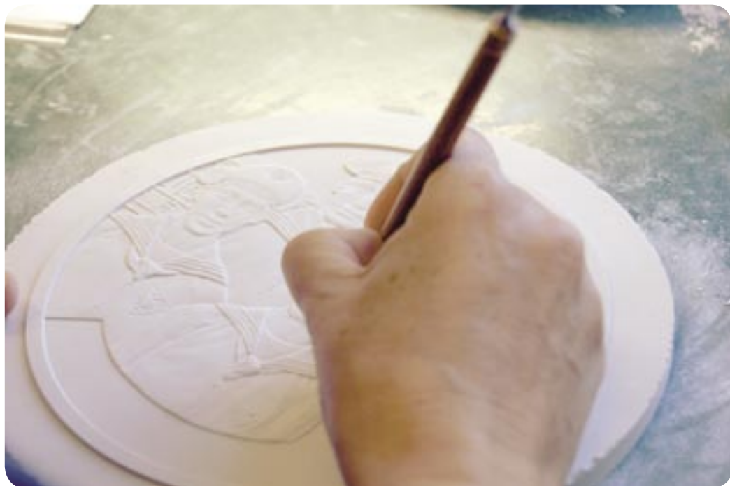
Motiv je treba najprej natančno narisati na večjo ploščo, nato se ta zmanjšuje do velikosti kovanca.

Ko se pomaknemo v naslednji prostor, smo končno priče izjemni