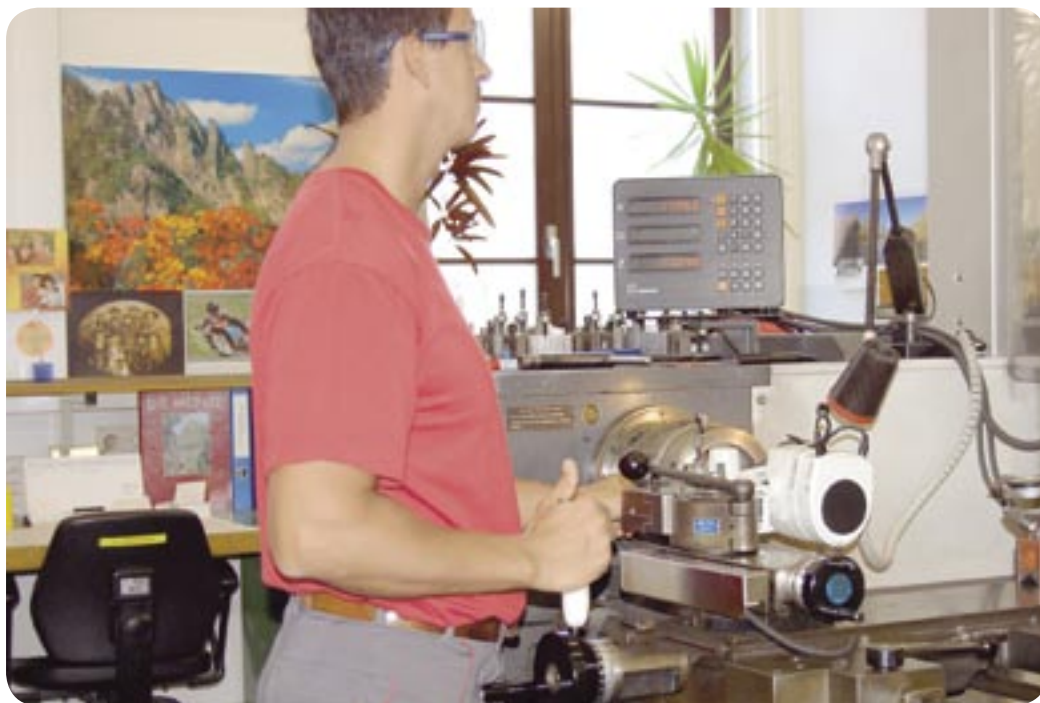
S stružnico je treba na kovancih in zlatnikih narediti milimeter ali še manj tanek rob.

količini zlatnikov, Dunajskih filharmonikov. Eno inč oziroma okoli 31 gramov težki zlatniki letijo iz stroja, nato jih zložijo v nekakšne palete, zapakirajo in pošljejo podjetjem in bankam, ki trgujejo z naložbenim zla-