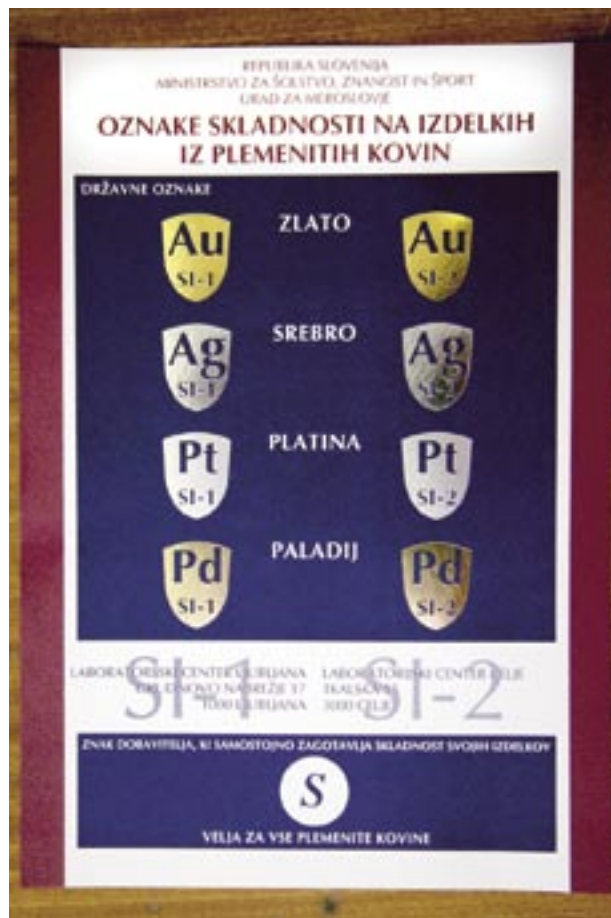
Slika, ki jo morate videti v vsaki prodajalni izdelkov iz plemenitih kovin.