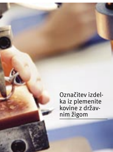
Označitev izdelka iz plemenite kovine z državnim žigom